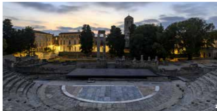
2. Théâtre antique

Une ville, deux théâtres. Le théâtre antique fut l'une des premières