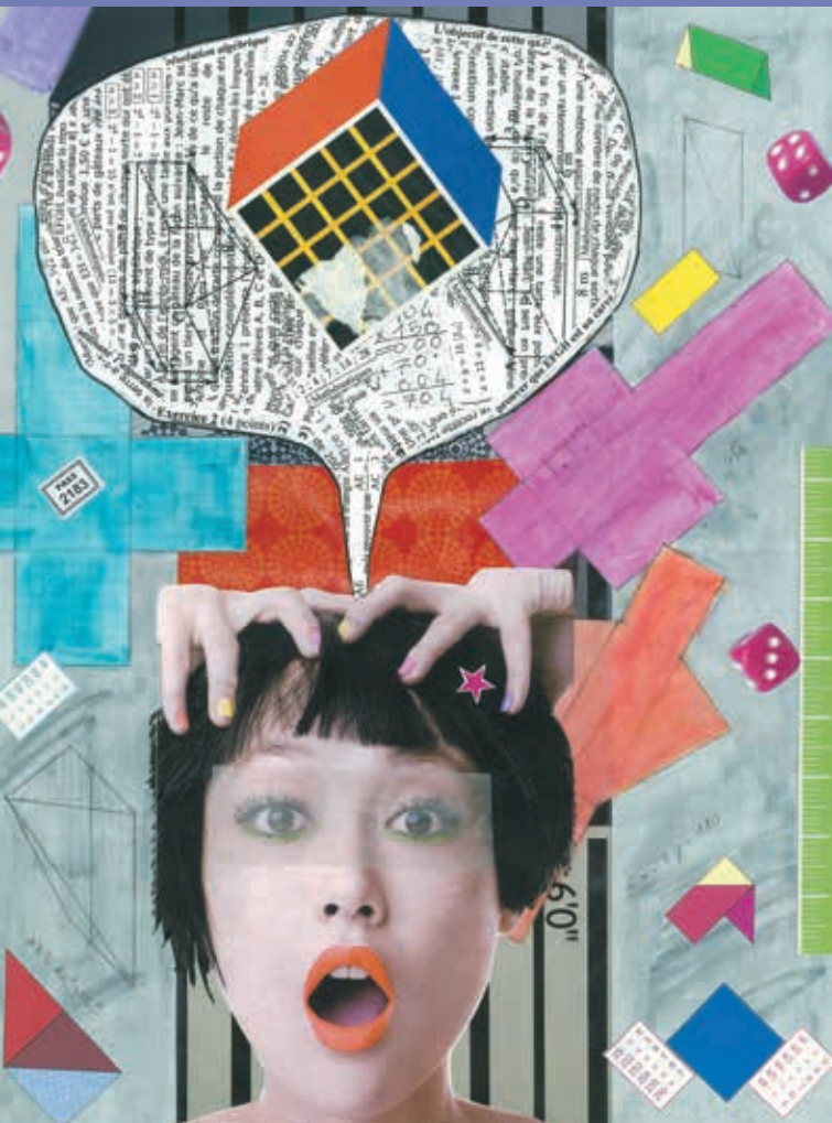
Illustration de couverture : Anitaaa