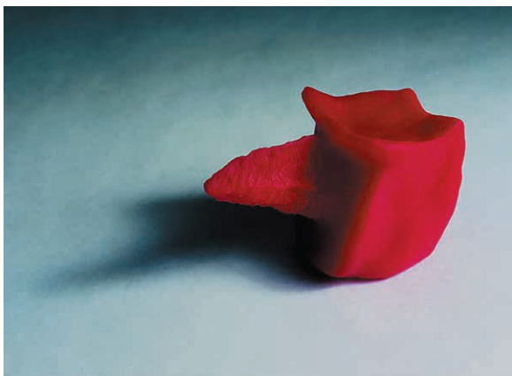
Christine Crozat, Vertèbre-visage, 2002, 7 x 11 cm

Dans le cadre de l'exposition consacrée aux 150 ans de sa collection, le musée Réattu invite cette année une artiste, Christine Crozat, qui présentera son travail ainsi que son parcours d'artiste au féminin. Le corps étant une problématique récurrente de son œuvre, elle l'évoquera avec nous lors de cette rencontre privilégiée.