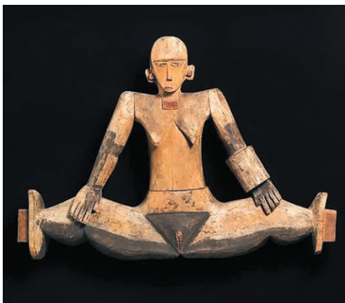
Sculpture - République des Palaos, Caroline Islands

Photo : La compagnie de l'ambre- De ses battements d'elles